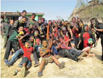
Fête des Couleurs