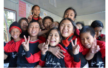
Eh oui, il y a de la joie...

NOUS NE POUVONS PAS LAISSER NAG EVOLUER SANS NOUS, C'EST A DIRE SANS VOUS.